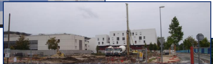
Aspect actuel du chantier